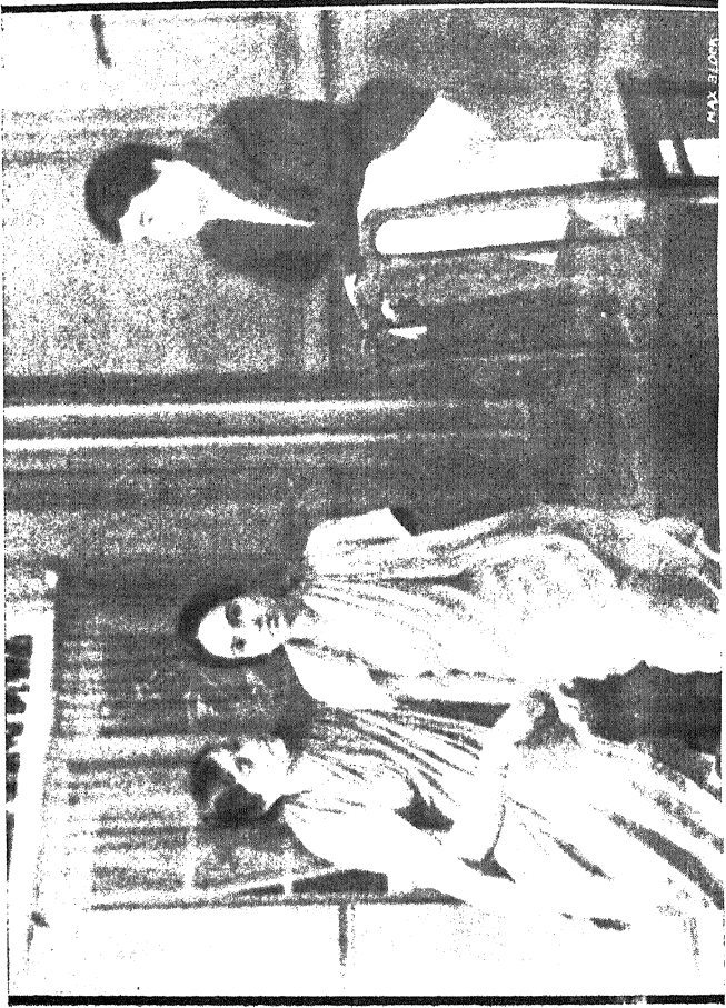
अंक ४ था ] विनायकः— तुम्ही दोगांनी जायची तयारी चालवली आहे इथून ? [ पान १०५